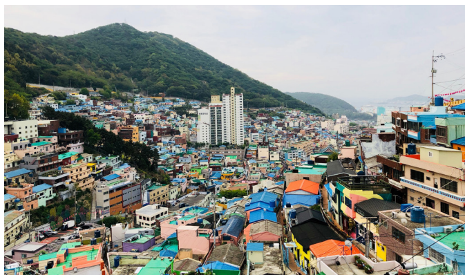
Daerah kumuh dan elit yang berdampingan

Di kota-kota besar Indonesia, pembangunan perkantoran dan hunian menengah-atas semakin meningkat. Tetapi pembangunan ini tidak paralel dengan pembangunan untuk pengentasan kemiskinan.